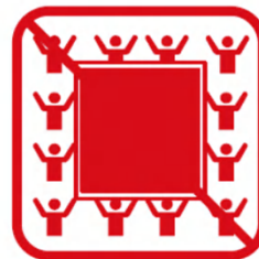
ビッグフラッグ ※ただし、お客様がいない席に 掲出する場合を除く