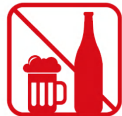
アルコール飲料の 持ち込み