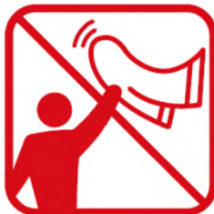
タオルマフラー、大旗含む フラッグなどを「振る・回す」