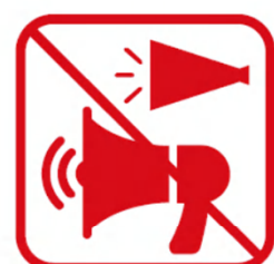
トラメガを含む メガホンの使用