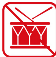
太鼓などの鳴り物