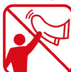
タオルマフラー、大旗含む フラッグなどを「振る・回す」