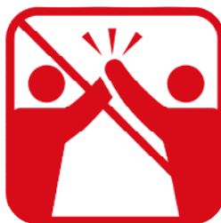
ハイタッチ、肩組み、 握手、抱擁