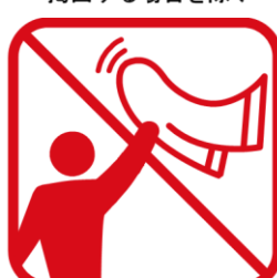
タオルマフラー、大旗含む フラッグなどを「振る・回す」