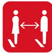
社会的距離 (できるだけ2m、最低1m)を 保つようにしてください