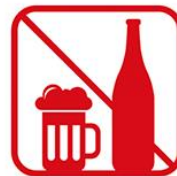
アルコール飲料の 持ち込み