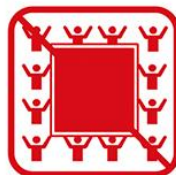
ビッグフラッグ ※ただし、お客様がいない席に 掲出する場合を除く