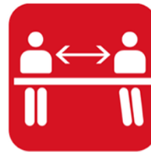
前後左右1席ずつ空けて ご着席ください