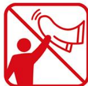
タオルマフラー、大旗含む フラッグなどを「振る・回す」