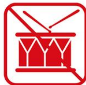
太鼓などの鳴り物