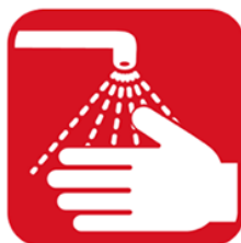
手洗い、消毒を こまめにしましょう