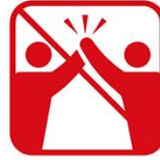
ハイタッチ、肩組み、握手、抱擁