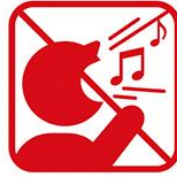
歌を歌うなど声を出しての応援、指笛