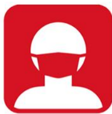
マスクを 着用してください