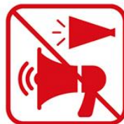
トラメガを含む メガホンの使用