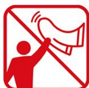
タオルマフラー、大旗含むフラッグなどを「振る・回す」