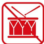
太鼓などの鳴り物