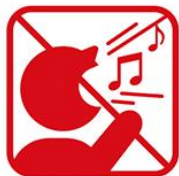
歌を歌うなど声を出しての応援、指笛