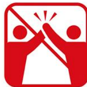
ハイタッチ、肩組み、握手、抱擁