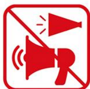
トラメガを含むメガホンの使用