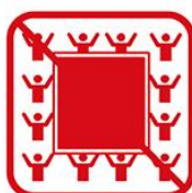
ビッグフラッグ ※ただし、お客様がいない席に掲出する場合を除く