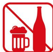
アルコール飲料の持ち込み