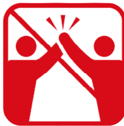
ハイタッチ、肩組み、 握手、抱擁