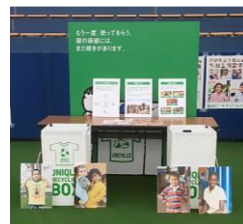
ユニクロリサイクルブース