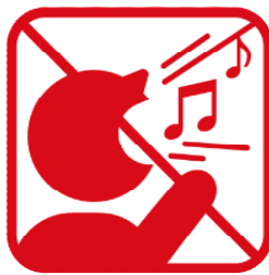
歌を歌うなど声を出しての応援、指笛