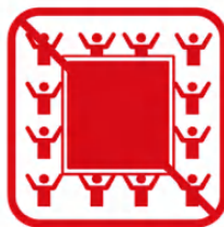
ビッグフラッグ ※ただし、お客様がいない席に掲出する場合を除く