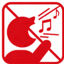
歌を歌うなど声を出しての応援、指笛