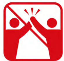
ハイタッチ、肩組み、 握手、抱擁