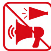
トラメガを含む メガホンの使用