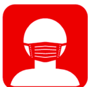
不織布マスクを 常時正しく着用してください