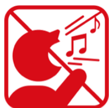
歌を歌うなど声を出しての応援、指笛