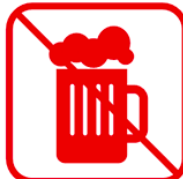
アルコールの持ち込み