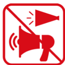
トラメガを含む メガホンの使用