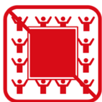
ビッグフラッグ ※ただし、お客様がいない席に掲出する場合を除く