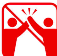
ハイタッチ、肩組み、握手、抱擁