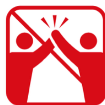
ハイタッチ、肩組み、 握手、抱擁