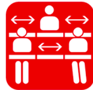
座席の移動はお控え頂き、 前後左右1席ずつ空けてご着席ください