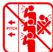
ピッチ方向以外を 向いての声出し